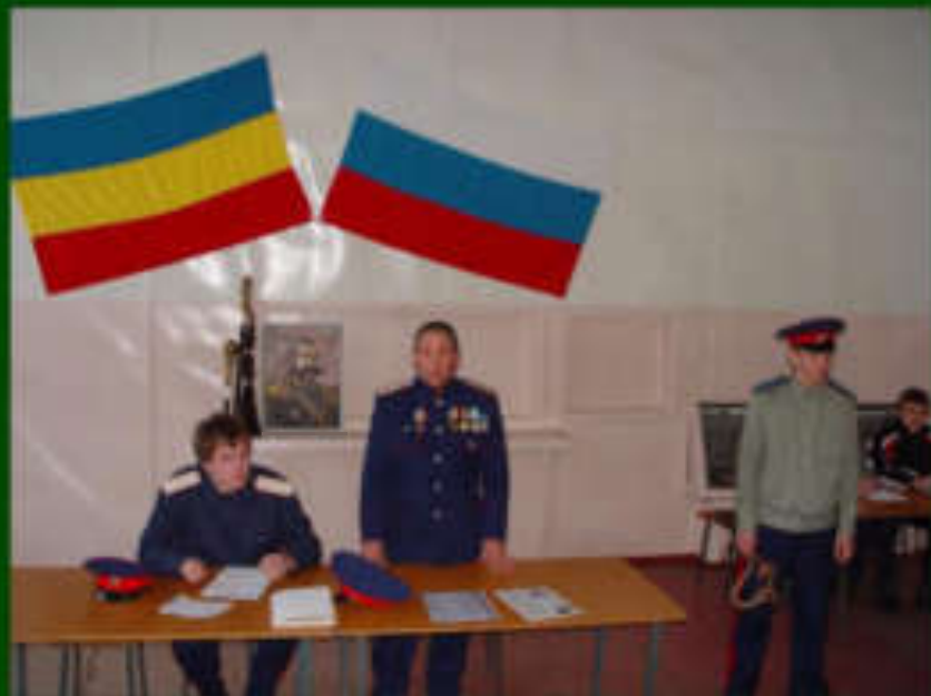
Большой казачий Круг в школе