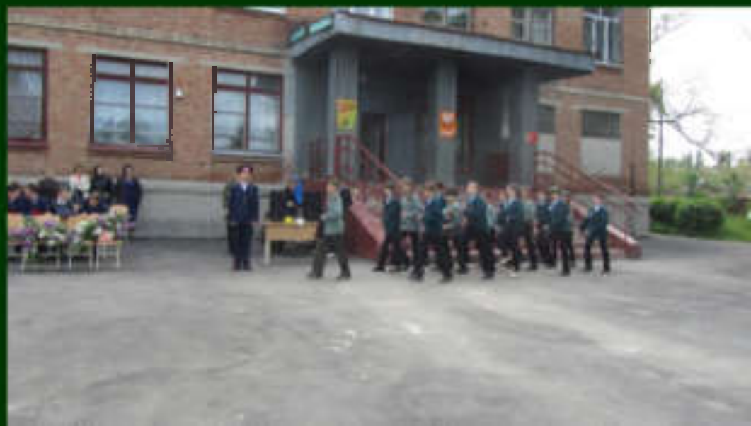
Смотр строя и песни, посвященный Великой Победе