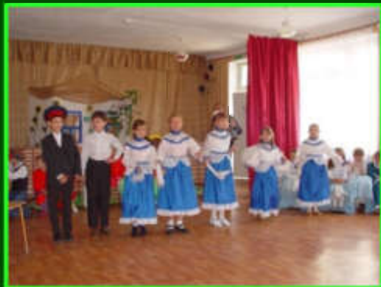
Выступление фольклорного ансамбля «Казачок»