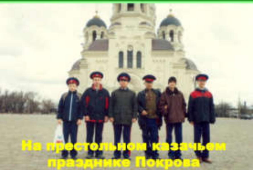
На престольном казачьем празднике Покрова