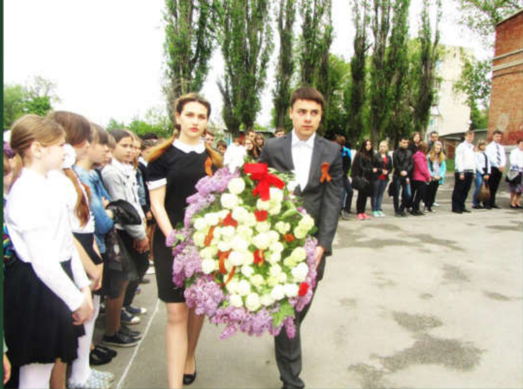
Возложение цветов воинам, 8 мая 2016 года