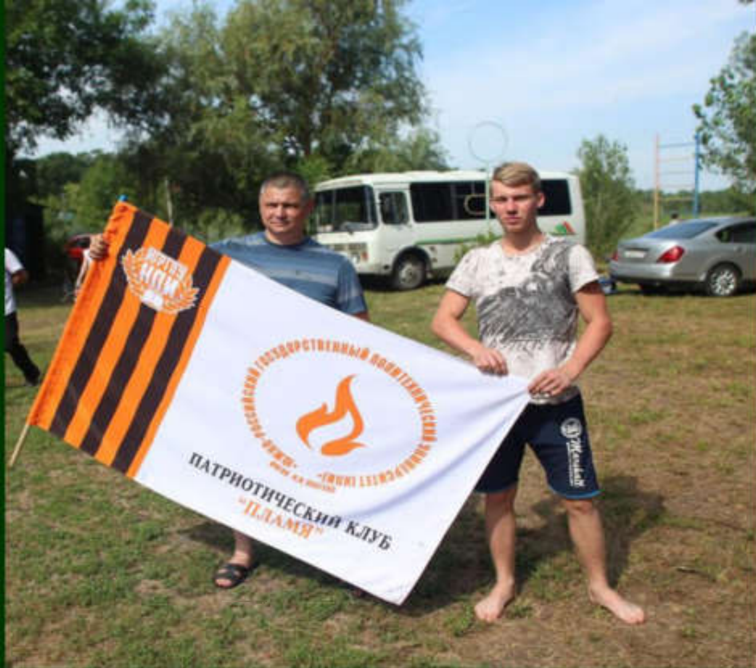
и патриотический клуб «Пламя»