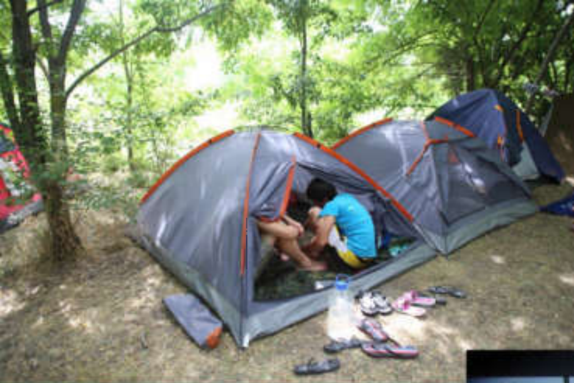
Сон в палатке