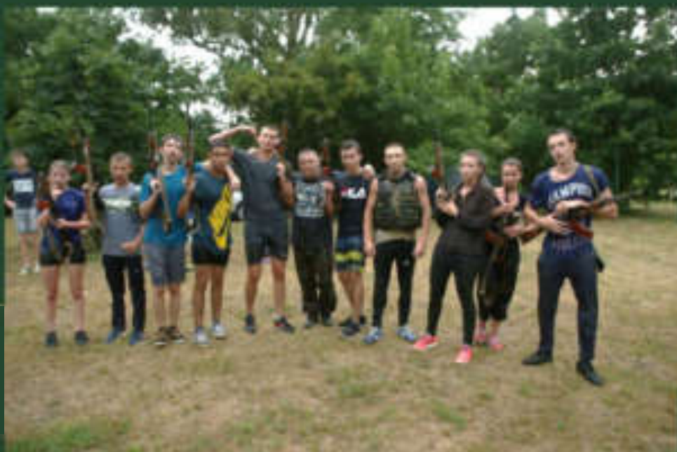
Команда МБОУСОШ 22 на сборах