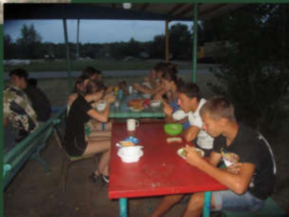
Обед на полевой кухне