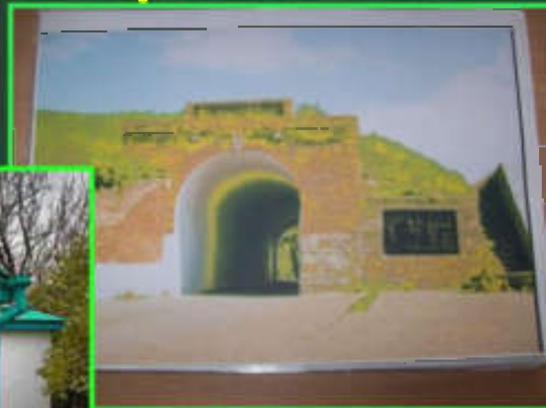
Азов. Пороховой погреб