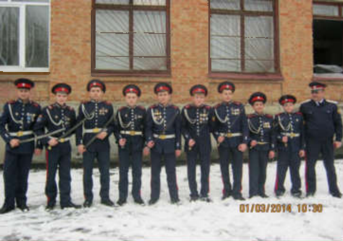
Выступление воспитанников Казачьего Кадетского корпуса