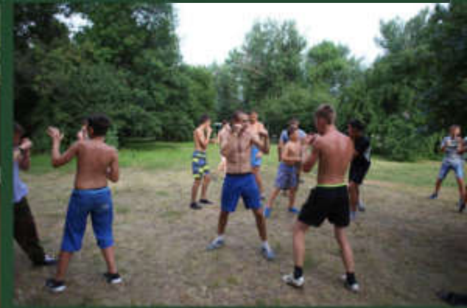
Сборка-разборка автомата, тренировки, соревнования...